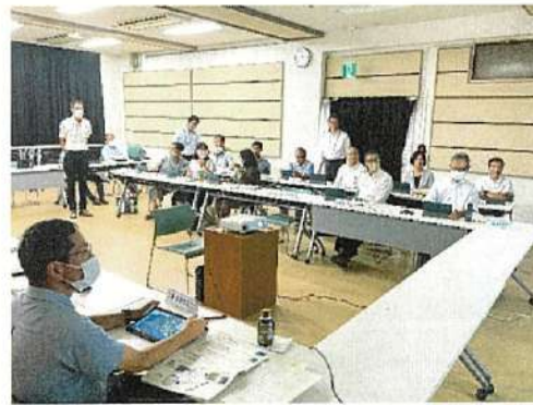
タブレット操作研修会の様子（左：焼津市 右：森町）