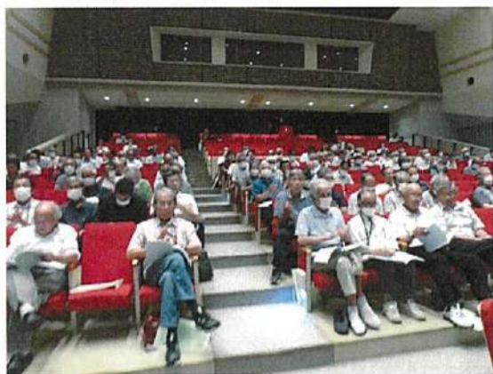
西部地区研修会の様子

県農業会議、静岡県、県農業振興公社（農地バンク）・県農業再生協議会の4者は、農地利用の最適化を推進するため、農業委員・農地利用最適化推進委員などを対象に、県内2地区で標記研修会を開催した。8月1日の西部地区（袋井市 袋井南コミュニティセンター）は242人、8月2日の中部地区（静岡市葵区 静銀ユーフォニア）は206人が参加した。