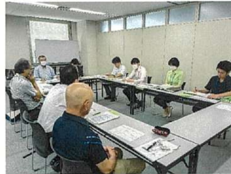
富士宮市農業委員会