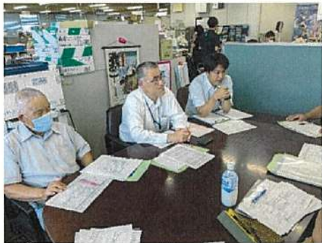
沼津市農業委員会