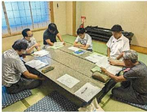
三島市農業委員会