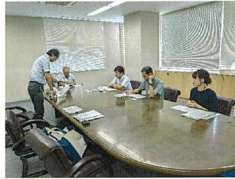
函南町農業委員会