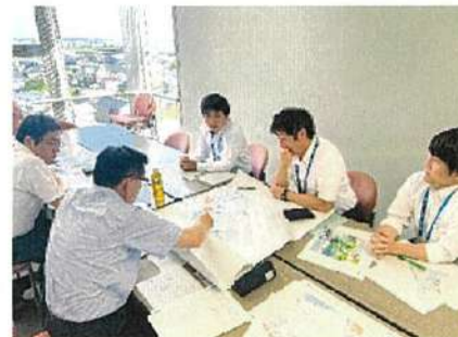
個別相談会の様子：南伊豆町（左） 御殿場市（中） 吉田町（右）