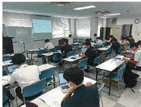
農業委員会サポートシステム操作研修会の様子（左：静岡市 右：沼津市）