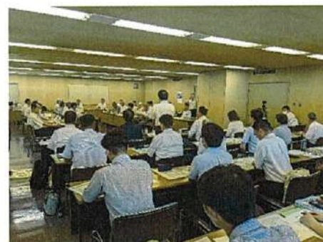
農地利用最適化研究会の様子